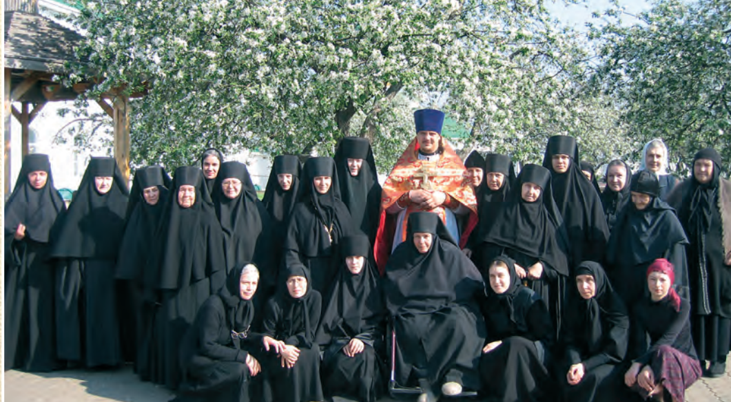
Алексеевский монастырь. 2010 г.