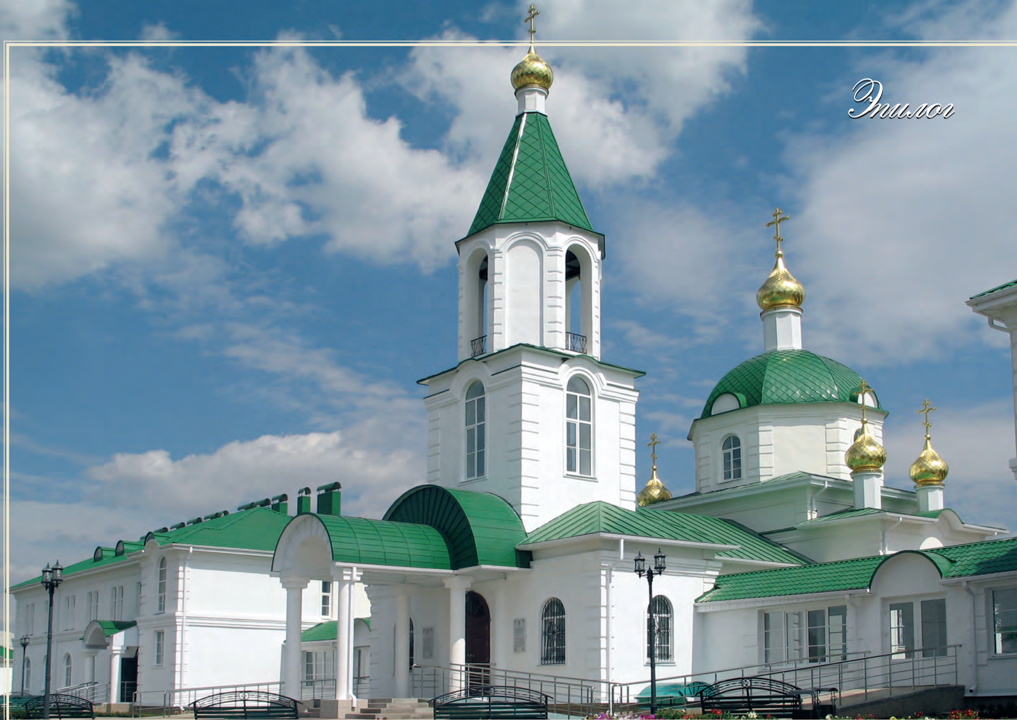
Монастырь во имя Алексея, человека Божия, Курской епархии