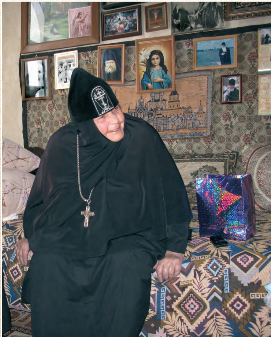
Матушка в своей келье в Золотухино