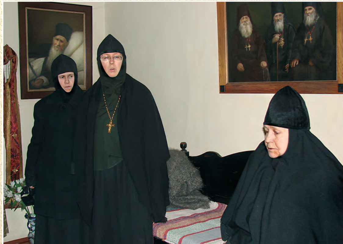
Посещение Оптиной пустыни в 2009 г. В келье прп. Амвросия Оптинского. Внизу: С братией Оптинского скита