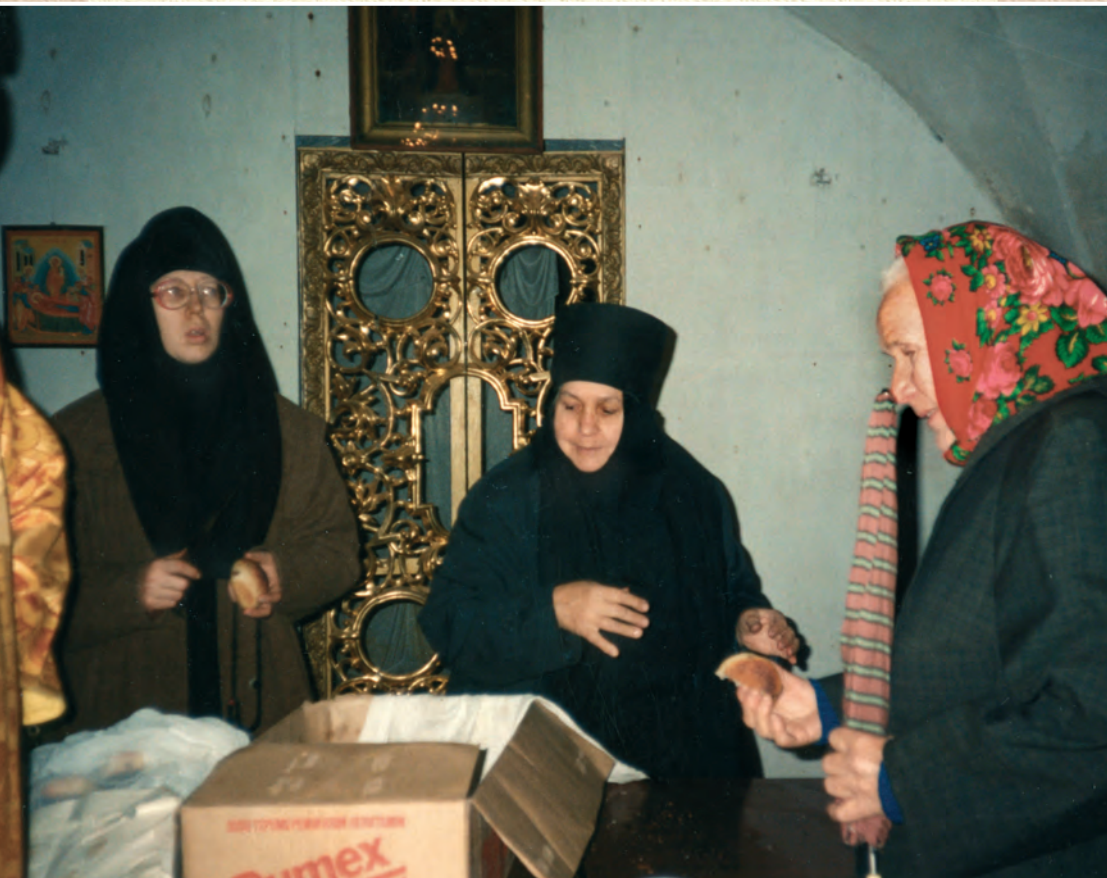
Матушка раздает угощение прихожанам после службы в праздник прп. Иосифа Волоцкого

Сегодня ночью было нашествие комаров. Мы всю ночь спать не могли и злились. Утром приходим к матушке, а она говорит: «Сегодня ночью напали на меня комары. А я думаю: раньше преподобные сами в комары шли, а я-то двух комаров не могу вынести». Матушка часто нас так вразумляет.