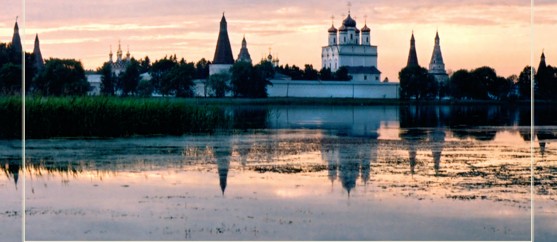
Иосифо-Волоцкий монастырь Московской епархии