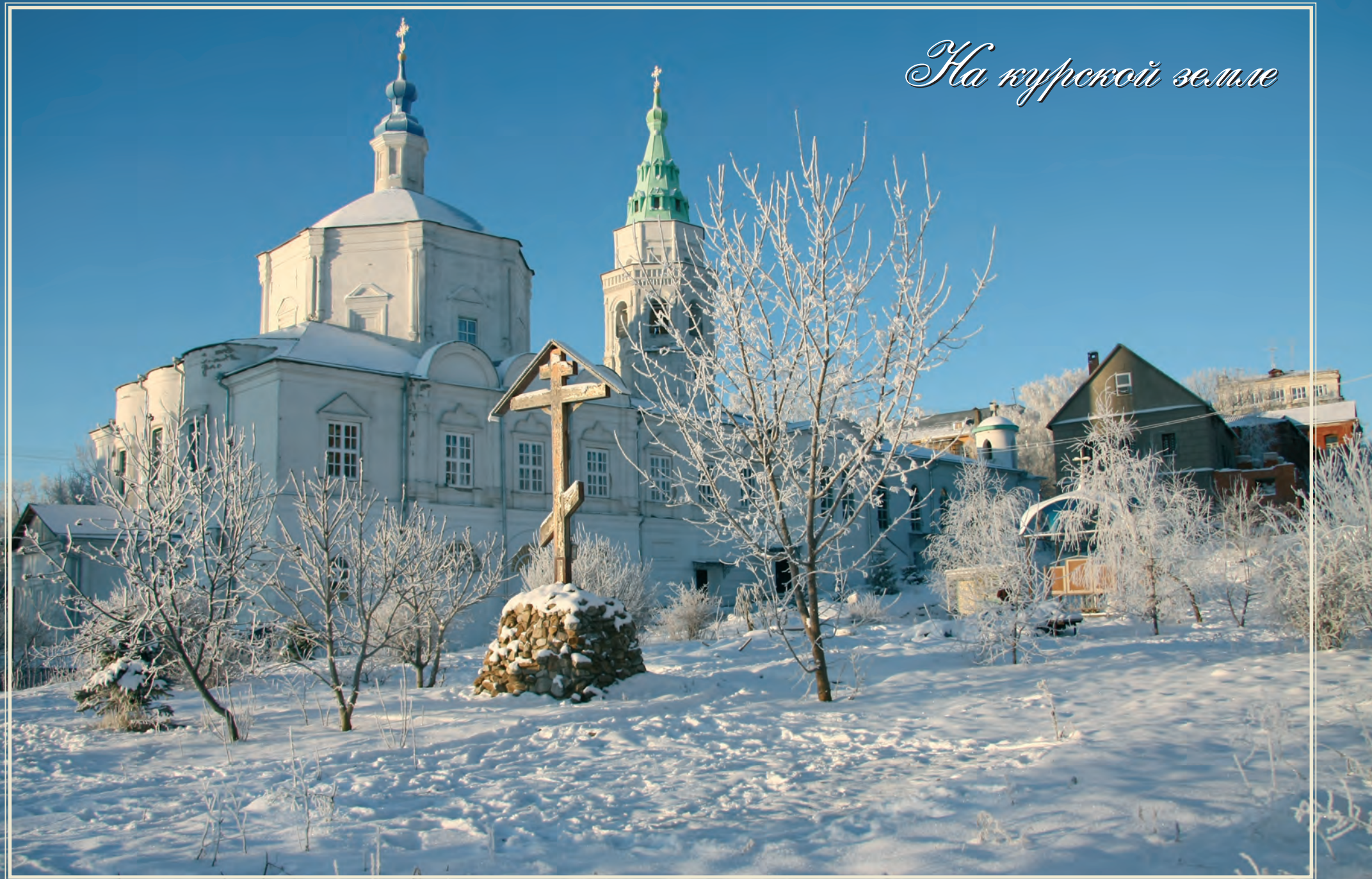
Курский Свято-Троицкий женский монастырь