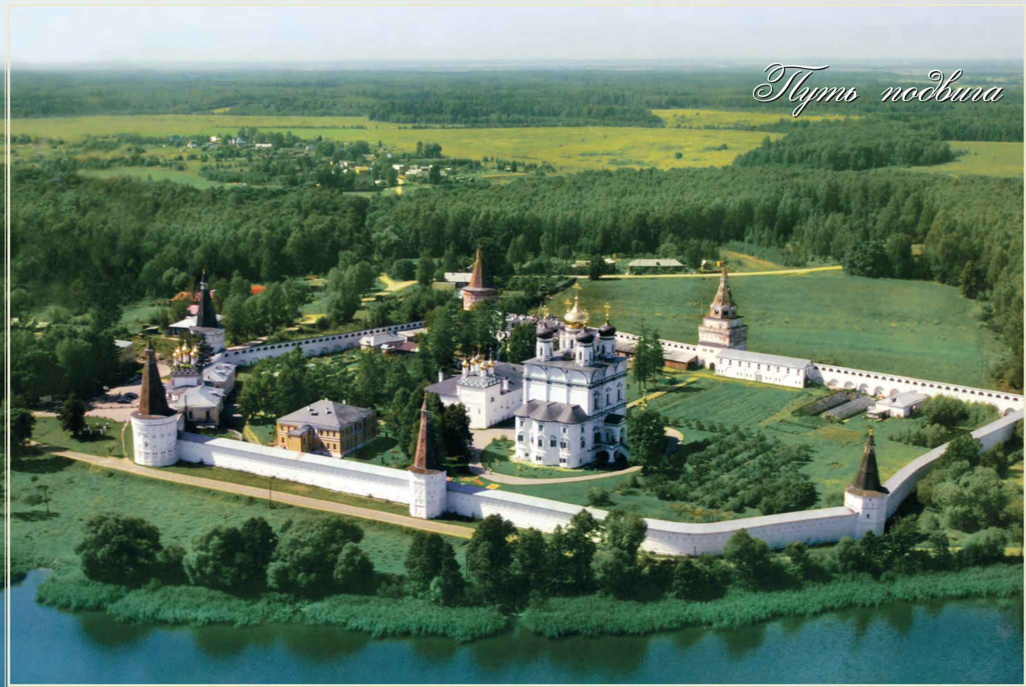
Иосифо-Волоцкий монастырь Московской епархии