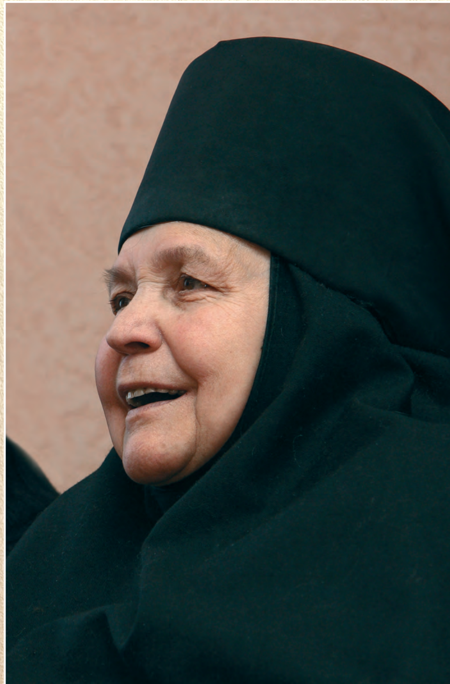
Справа: Матушка смотрит спектакль учеников детской воскресной школы