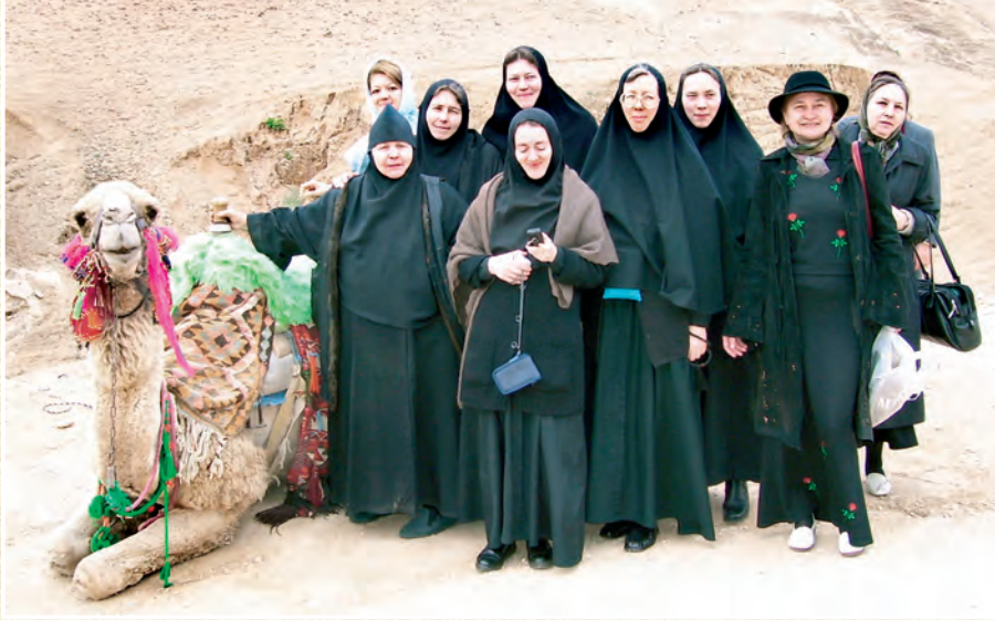
Слева: Паломническая поездка на Святую землю. Купание в Иордане