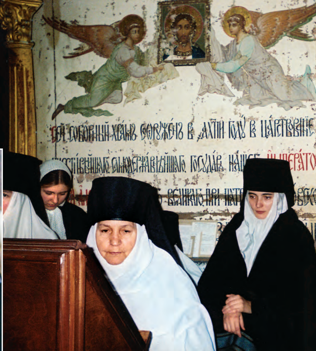
На клиросе Успенского собора Иосифо-Волоцкого монастыря

тушка говорила: хотя бы одними устами шепчи потихоньку «слава Тебе...». И уныние отступит, придет покой, тишина — Господь даст.