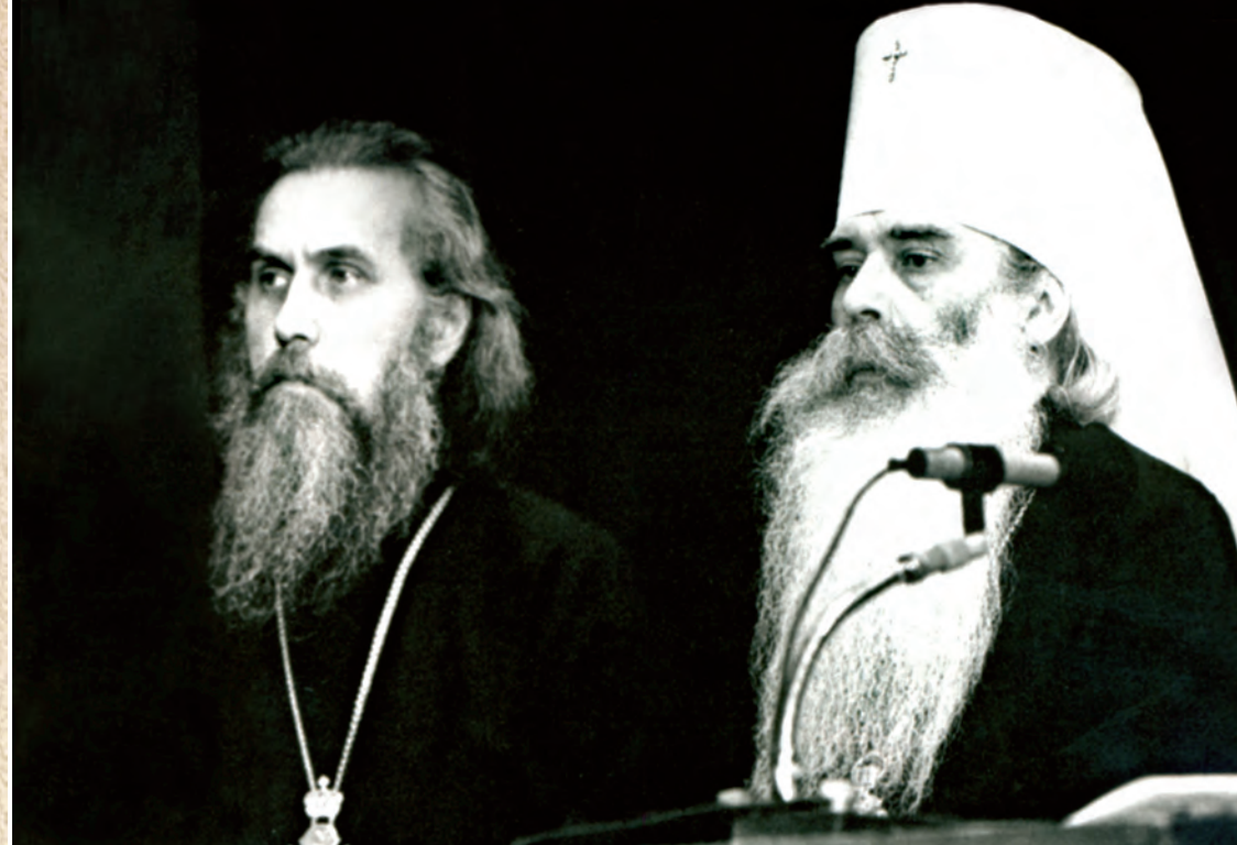
Митрополит Волоколамский и Юрьевский Питирим и архимандрит Иннокентий (Просвирнин)

* Питирим (Нечаев; 1926–2003), митрополит Волоколамский и Юрьевский, vicарий Московской епархии. Один из выдающихся иерархов Русской Православной Церкви, видный общественный деятель. Принадлежал к 300-летнему потомственному роду священнослужителей, состоял в тесном общении со многими представителями дореволюционного духовенства и непосредственно от них воспринял русскую церковную традицию. Его духовные наставники — это известный московский протоиерей Александр Воскресенский и представитель Оптинского старчества преподобноисповедник Севастиан Карагандинский. Четверть века владыка был ближайшим сотрудником патриарха Алексия I (Симанского). Он имел близкие доверительные отношения с такими духоносными личностями, как митр. Иосиф (Чернов) и архим. Иоанн (Крестьянкин), поддерживал общение с архиеп. Василием (Кривошеиным) и прот. Николаем Гурьяновым. Более 30 лет владыка возглавлял Издательский отдел Московского Патриархата. Перед кончиной был келейно пострижен в схиму. Митр. Питирим почил на 78-м году жизни (4.11.2003), отдав 60 лет служению Церкви, из них 40 — в архиерейском сане.