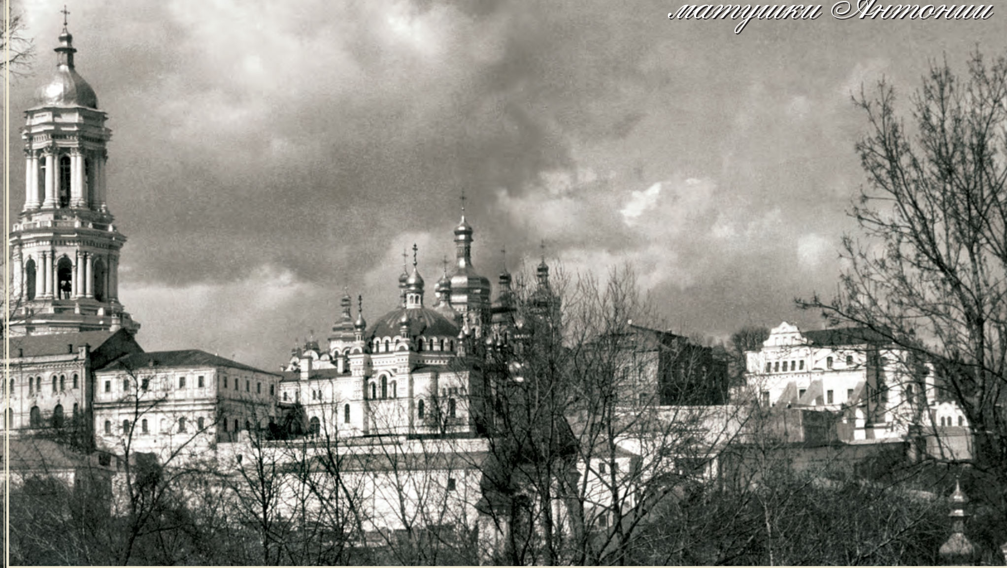
Свято-Успенская Киево-Печерская Лавра