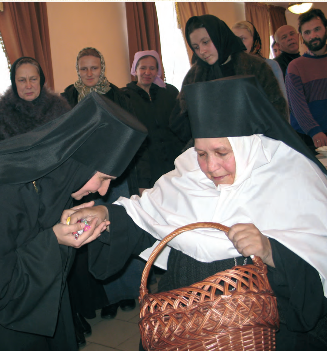
День рождения матушки. 2008 г.